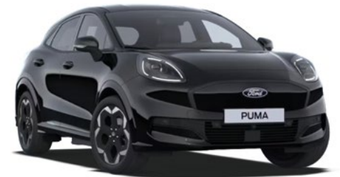
AGATE BLACK - lakier metalizowany 2 500 zł Bez dopłaty dla wersji BlueCruise