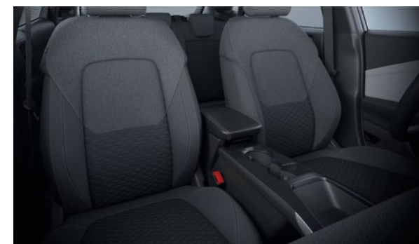
Ford Puma® Gen-E w wersji Puma w kolorze Digital Aqua Blue (wymaga dopłaty) Wnętrze: Tapicerka materiałowa (wyposażenie standardowe)