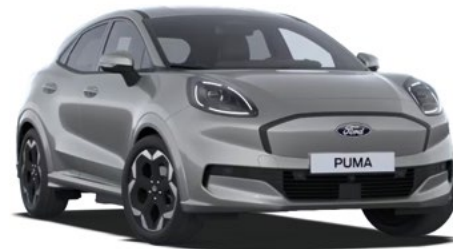
SOLAR SILVER - lakier metalizowany 2 500 zł Bez dopłaty dla wersji BlueCruise