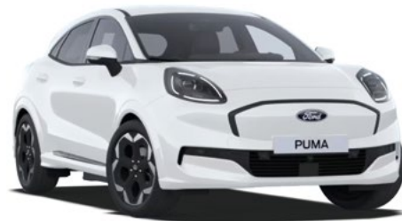
FROZEN WHITE - lakier zwykły 1 000 zł Lakier niedostępny dla wersji BlueCruise