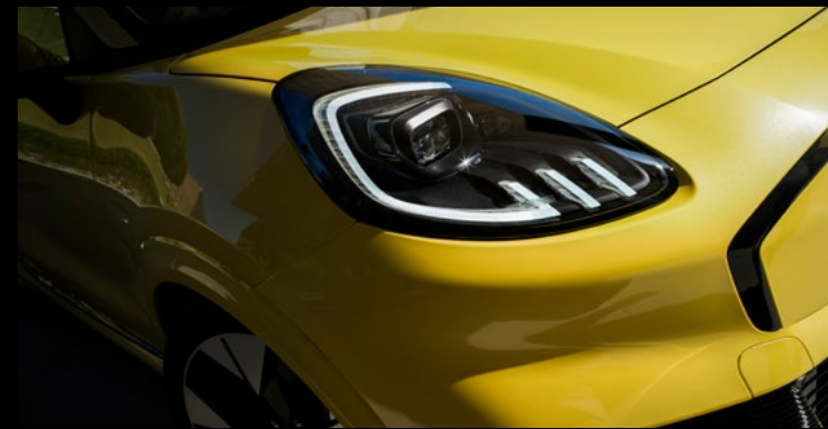
Reflektory Full LED - matrycowe, adaptacyjne Wyposażenie opcjonalne dla wersji Premium i BlueCruise