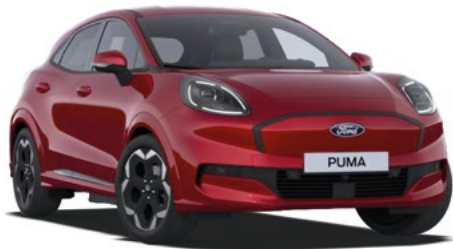
FANTASTIC RED - lakier metalizowany specjalny 3 800 zł Lakier niedostępny dla wersji BlueCruise