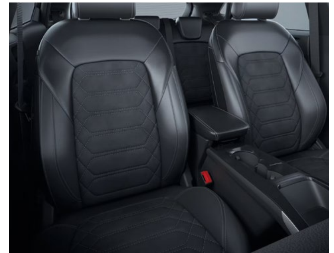
Ford Puma® Gen-E w wersji Premium z pakietem Black