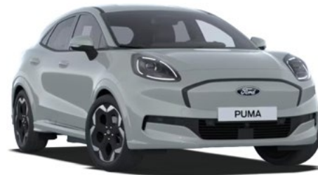
CACTUS GREY - lakier specjalny 2 500 zł Lakier niedostępny dla wersji BlueCruise