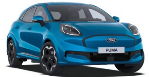
DIGITAL AQUA BLUE - lakier metalizowany specjalny 2 500 zł Lakier niedostępny dla wersji BlueCruise