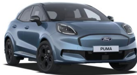
VAPOUR BLUE - lakier metalizowany specjalny Bez dopłaty Lakier dostępny dla wersji BlueCruise