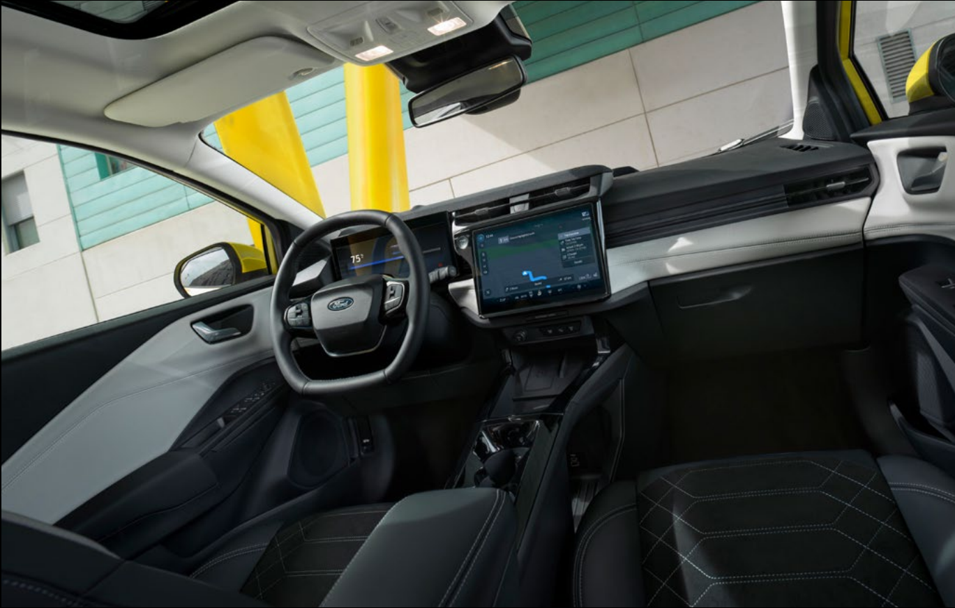
Nowy Ford Puma Gen-E® w wersji Premium z opcjonalnym wyposażeniem

Ciesz się doskonałą jakością dźwięku dzięki systemowi nagłośnienia Premium B&O, który obejmuje wzmacniacz o mocy 650W, 10 głośników (w tym subwoofer) - standard w wersji Premium. Przeniesienie dźwigni zmiany biegów na kierownicę pozwoliło wygospodarować dodatkowy, pojemny schowek pomiędzy fotelami.