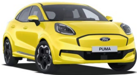
ELECTRIC YELLOW - lakier zwykły bez dopłaty Lakier niedostępny dla wersji BlueCruise