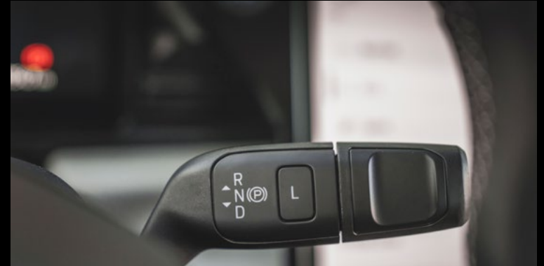
Dźwignia zmiany biegów - przy kierownicy Wyposażenie standardowe wszystkich wersji